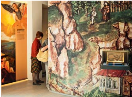
Visionen weisen den Weg

gerissen zwischen verschiedenen Anforderungen. Der fromme Mann gerät in eine schwere Krise und bricht mit fünfzig Jahren radikal mit dem bürgerlichen Leben, um alleine Gott zu dienen.