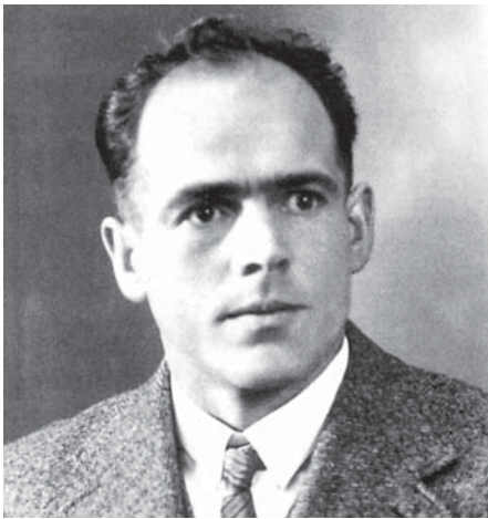
Franz Jägerstätter († 9. August 1943)

Im neu eingerichteten Museum Bruder Klaus gibt es einen Raum für Wechselausstellungen. Dieses Jahr zeigt die Friedensbibliothek Berlin eine Dokumentation zu Franz Jägerstätter. Er wurde am 9. August 1943 vom Nazi-Regime umgebracht und am 26. Oktober 2007 im Dom zu Linz seliggesprochen. Seine Frau Franziska konnte am 4. März 2013 den 100. Geburtstag feiern.