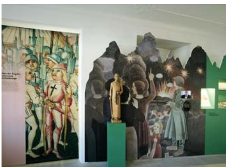
Vorläufer moderner Friedensarbeit

Das herrschaftliche Bürgerhaus von 1784 an der Dorfstrasse 4 im Zentrum von Sachseln beherbergt seit 1976 das Museum Bruder Klaus. Nach 35 Jahren wurde das Museum baulich und inhaltlich erneuert. Haus und Ausstellung wurden fit gemacht für das 21. Jahrhundert.