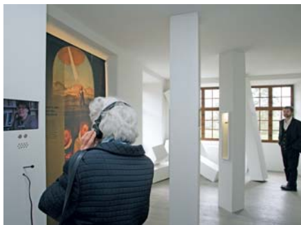
Eine schwierige Entscheidung

Die neue Grundaussstellung stiess beim Publikum auf Begeisterung, wie Einträge im Gästebuch belegen (vgl. Ausschnitte auf dieser Seite). Mit ihr wurde das Museum Bruder Klaus im vergangenen Jahr für einheimische Besucherinnen und Besucher, Pilger und Touristen aus dem In- und Ausland, für Kunst- und Kulturinteressierte neu ein attraktiver Anziehungs- und Treffpunkt. 6'000 Gäste in sieben Monaten sorgten für ein Spitzenergebnis. Eine Rekordzahl von hundert Gruppen buchte Führungen. Die über dreissig Workshops für Schulklassen sowie der Kinderclub und der Jugendclub des Museums richteten sich mit Erfolg an das Publikum von morgen.