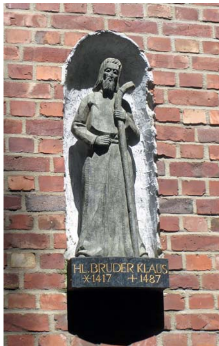
An der südlichen Aussenwand der Kirche steht in einer Mauernische eine Statue des Patrons.

Damit war gleichzeitig der Name für die Siedlung festgelegt: Bruder-Klaus-Siedlung.