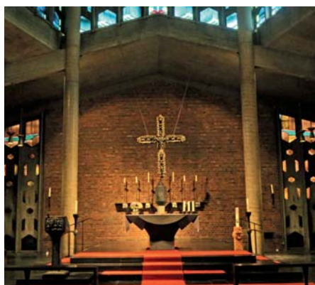
Der Hauptaltar der Pfarrkirche Bruder Klaus